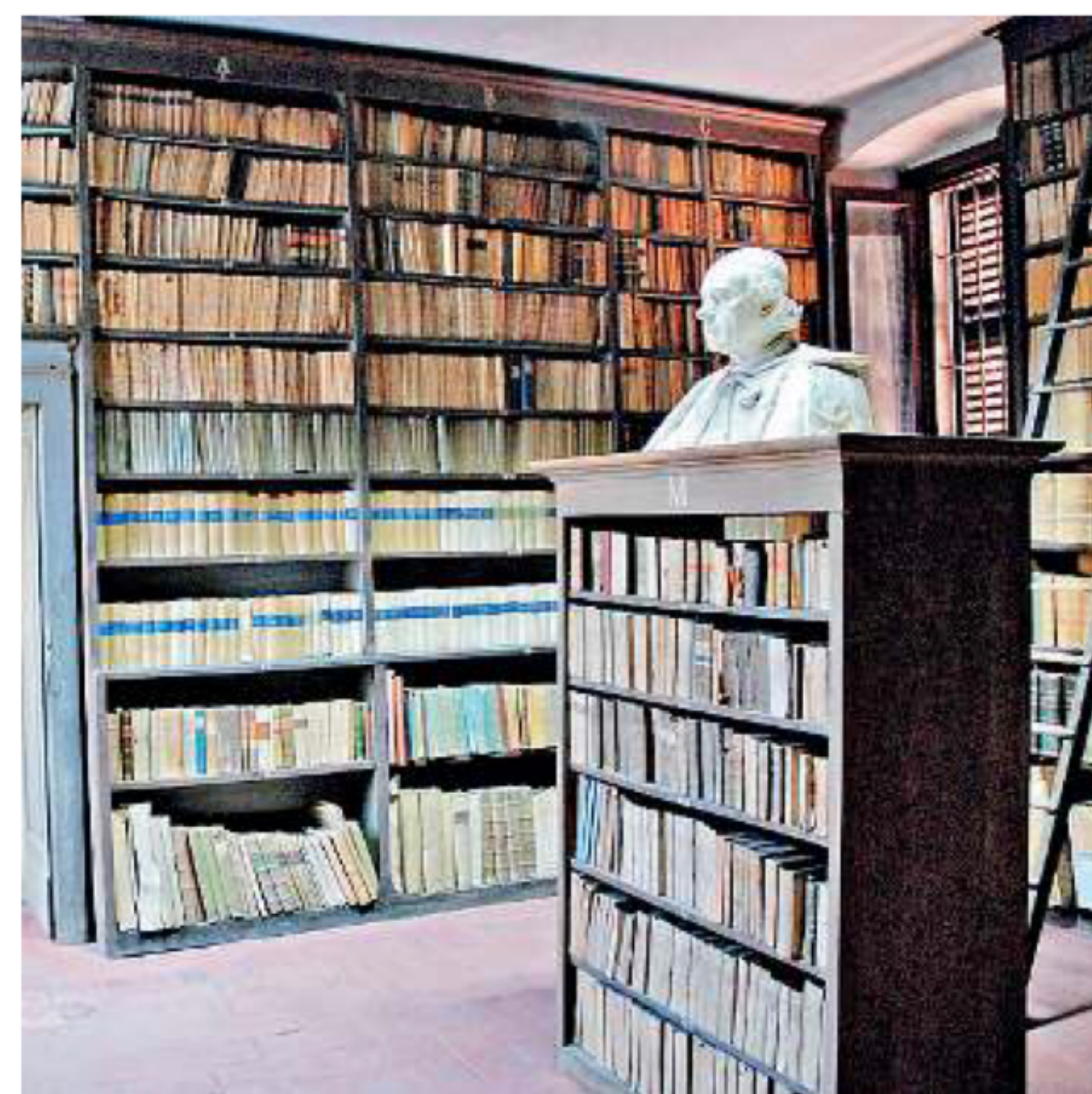
Cultura. Protagonista la Fondazione Biblioteca Morcelli Pinacoteca Reposi

Al lavoro. Gli studenti hanno lavorato al progetto durante l'intero anno accademico, con l'intento di creare uno strumento per la valorizzazione di una realtà culturale del territorio bresciano, sfruttando le potenzialità dei dispositivi multimediali. «Prendendo come spunto il sito della Fondazione, abbiamo scelto di realizzare un e-book caratteriz-