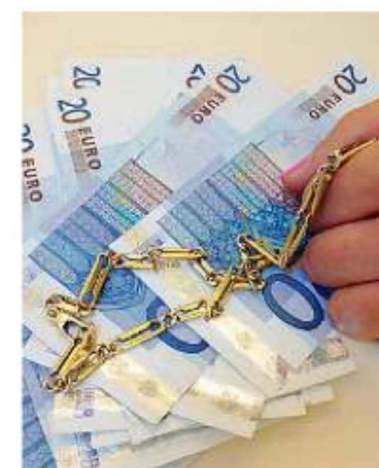
Il colpo. Una catenina d'oro è il bottino del furto

■ Ha colpito ancora la banda della berlina nera con targa tedesca che da qualche mese si aggira nella Bassa puntando anziani soli per strada. L'ultimo episodio in ordine di tempo, il quinto da febbraio secondo i carabinieri della Compagnia di Verolanuova, sarebbe avvenuto attorno alle 15 di ieri nel centro di Pontevico. A finire nel mirino della banda sarebbe stata una 70enne del pae-