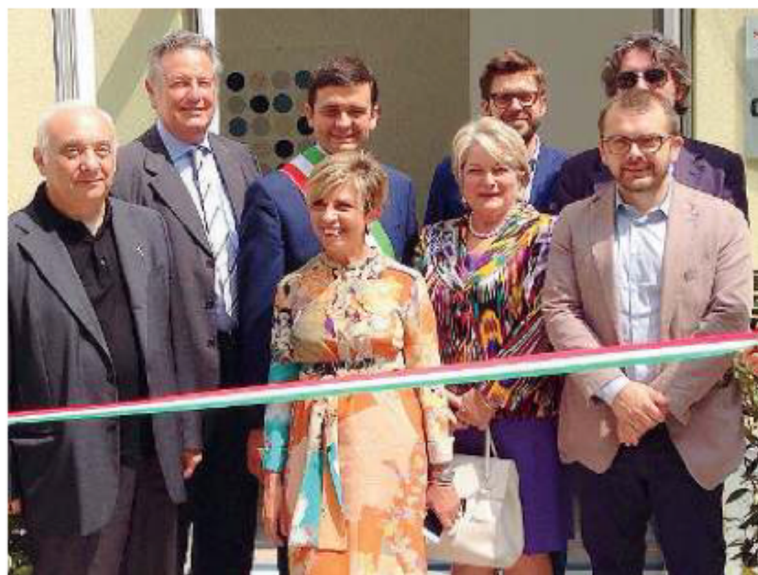
L'inaugurazione. Le autorità al momento del taglio del nastro